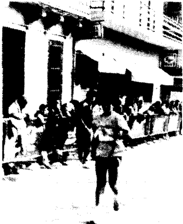
Un marxador infantil