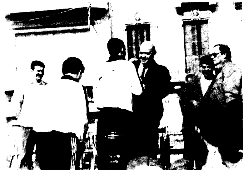
El guanyador rebent el seu trofeu