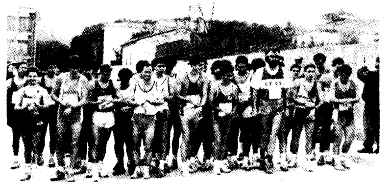
Tot a punt per començar la gran categoria

L'èxit assolit és la prova més clara d'una bona organització. La prova de Llinars entra a formar part de la cadena de curses de marxa atlètica de la Federació Catalana amb l'objectiu d'assolir fites més importants, com podria ser entrar en el rànking estatal i en un demà no massa llunyà esdevenir internacional. Els organitzadors de Llinars han donat proves d'una excel·lent capacitat organitzadora. La participació de marxadors fou bona, encara que amb l'assoliment de noves fites federatives pensen assolir una millor participació d'atletes d'élite. Els atletes veuen amb bons ulls la prova de Llinars, però altres obligacions els n'han apartat.