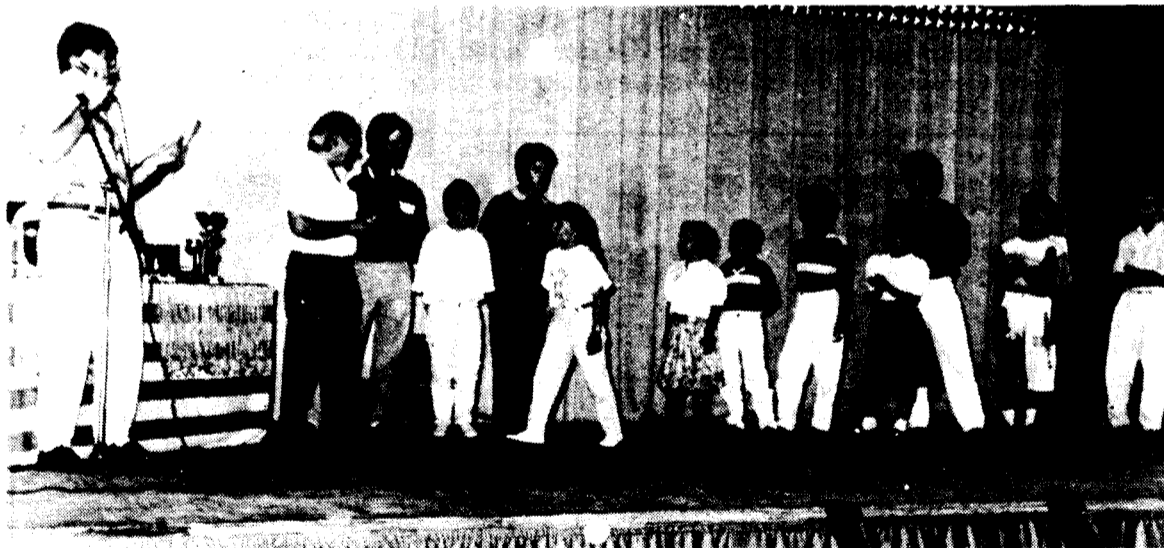
Els esportistes de Bigues van fer el seu sopar

Un cop finalitzat el lliurament de premis es va cloure la Festa Major de Bigues 1.990 amb el VI Festival de Dansa Jazz a càrrec dels alumnes de l'Escola de Dansa Jazz de la Montse Bufí. D'aquesta forma van acabar les Festes d'un poble petit però no per això poc animat.