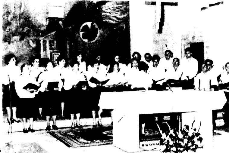
Coral l'Amarant de Bigues