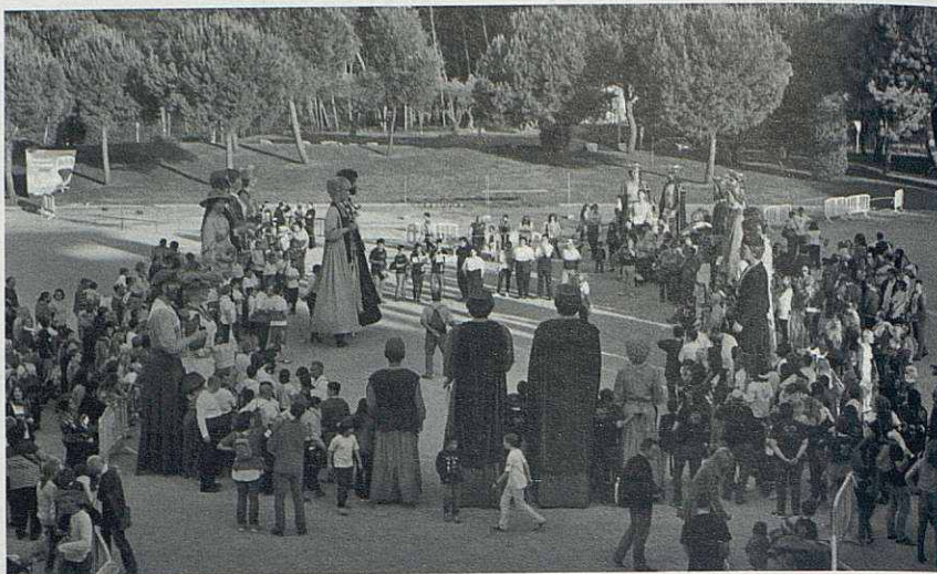
Ballada dels gegants.

El dissabte 26 d'abril les activitats van iniciar-se al casal de Can Prat amb un seminari d'educació canina bàsica, organitzat pel Club Esportiu Happy Dog Park i a la plaça de la Vila