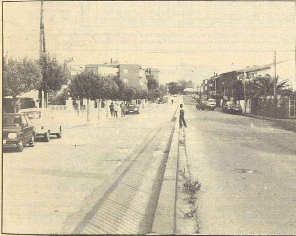
La acera de la izquierda es Parets, la de la derecha es el barrio de Lourdes, Mollet.

la Riera Seca y la Escuela de la Policía Autónoma de la Generalitat. Para situar de una manera evidente la ubicación del barrio, nos referiremos a la entrada de la Autopista