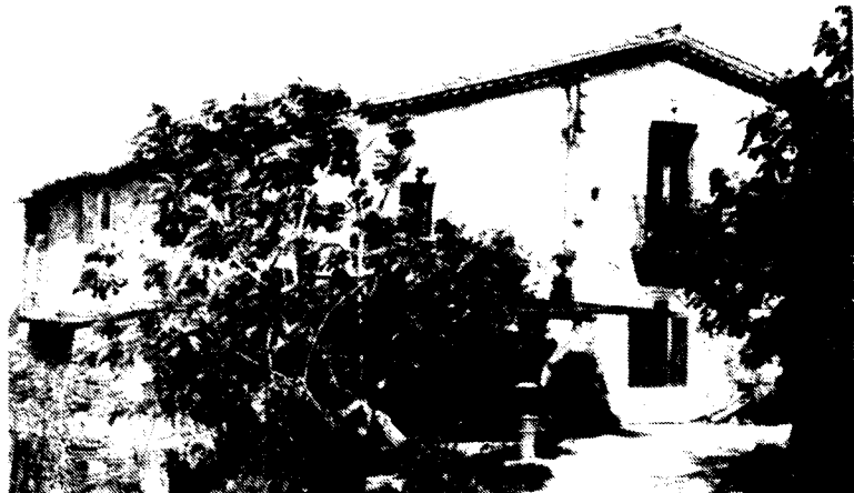
Can Farnés, situada al barri de la Serra

La jornada d'inauguracions s'acabarà amb una visita a l'escola bressol i amb un acomiadament del president de la Generalitat al Casal Social.