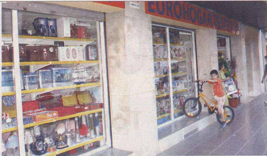
Els basars són els comerços més presents als carrers de la ciutat

La proliferació, durant els últims anys, dels comerços regentats per estrangers és evident. Actualment, a Mollet n'hi ha 25 basars/botigues Tot 0'60E i 14 locutoris. La seva presència als carrers de la ciutat no passa desapercebuda, sobretot als més centrals, com ara la Rambla Nova, Gaietà Víncia i carrers adjacents, on actualment s'hi troben més d'una dotzena d'aquest tipus de botigues. Locutoris, basars orientals, botigues tèxtils o d'alimentació són alguns exemples. La majoria d'aquests negocis són de caràcter familiar i responen a una demanda econòmica per part dels immigrants, els quals reben recolzament dels seus propis compatriotes i els hi facilita l'accés a la financiació. Això podria explicar que hagin pogut emprendre la seva pròpia activitat en poc temps. També