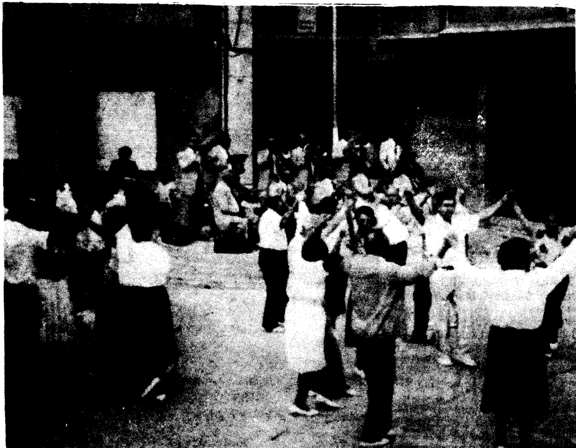
Diumenge vinent hi ha audició i ballada de sardanes a Caldes de Montbui, Martorelles, la Roca i Santa M' de Palautordera.

Minotes, 12 Tel. 90 814 10 62 (prov.) 08400 GRANOLLERS