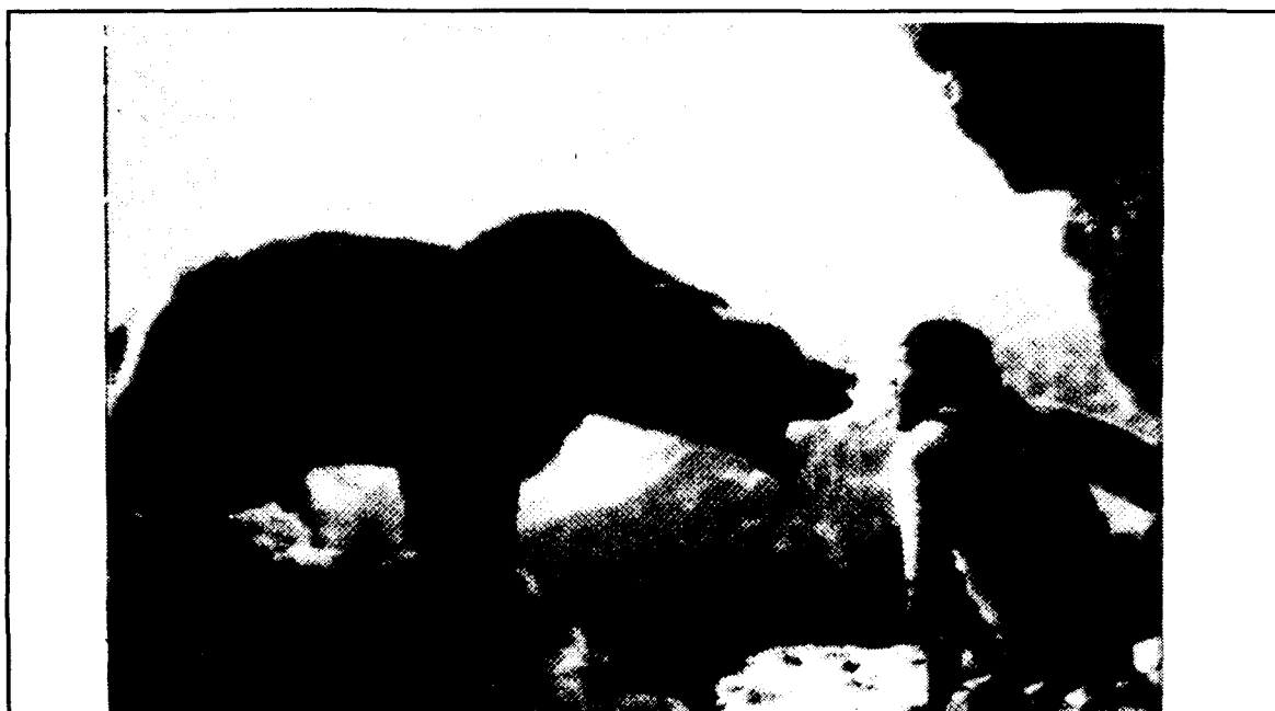
El diumenge vinent es projectarà a Cardedeu el film "El Oso", dins les primeres jornades de cinema ecològic.

Minetes, 12 Tel. 90 814 10 62 (prov.) 08400 GRANOLLERS