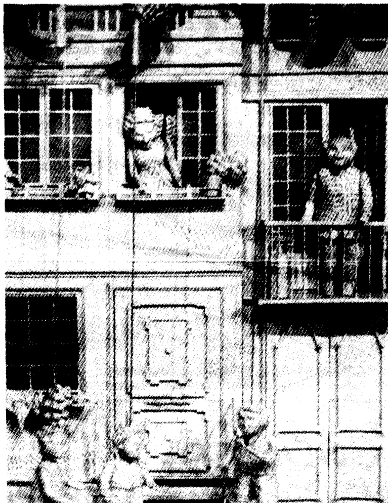
Diumenge vinent espectacle de titelles al Cercle Cultural de la Caixa sota el nom "Sopa de lletres".