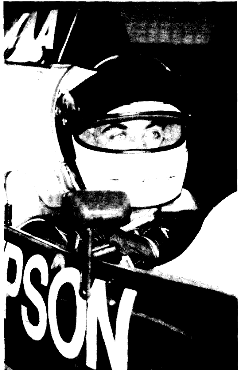
PROST amb el Ferrari no va poder acabar el 48 G.P. de Mònaco per una fallada en l'alternador.

Alesi en la seva primera cursa al principat de Mònaco, ha demostrat que no és un pilot verd, sinó tot el contrari. Berger s'ha classificat tercer i mai no ha donat la sensació de poder avançar al francès Alesi. Quart ha estat Boutsen, cinquè Caffi donant uns 2 punts valuosos a Arrow i sisè Bernard, també donant un punt que val el seu pes en or a l'escuderia Espo-Larrousse.