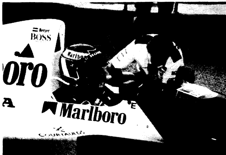
ALESI amb el Tyrrell-Ford ha demostrat a Mònaco que està en el bon camí