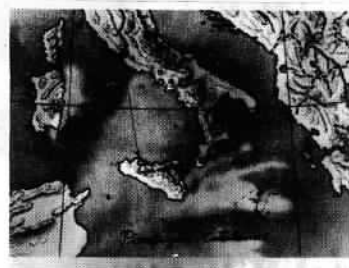
Mapa de l'expedició