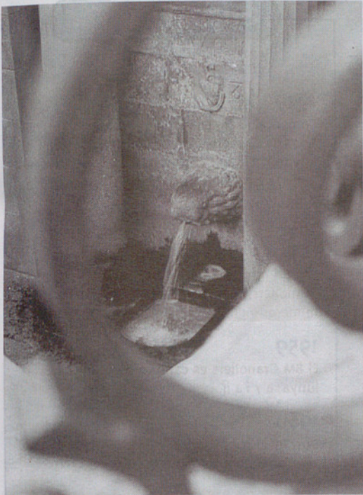
La conocidísima Font del Lleó.