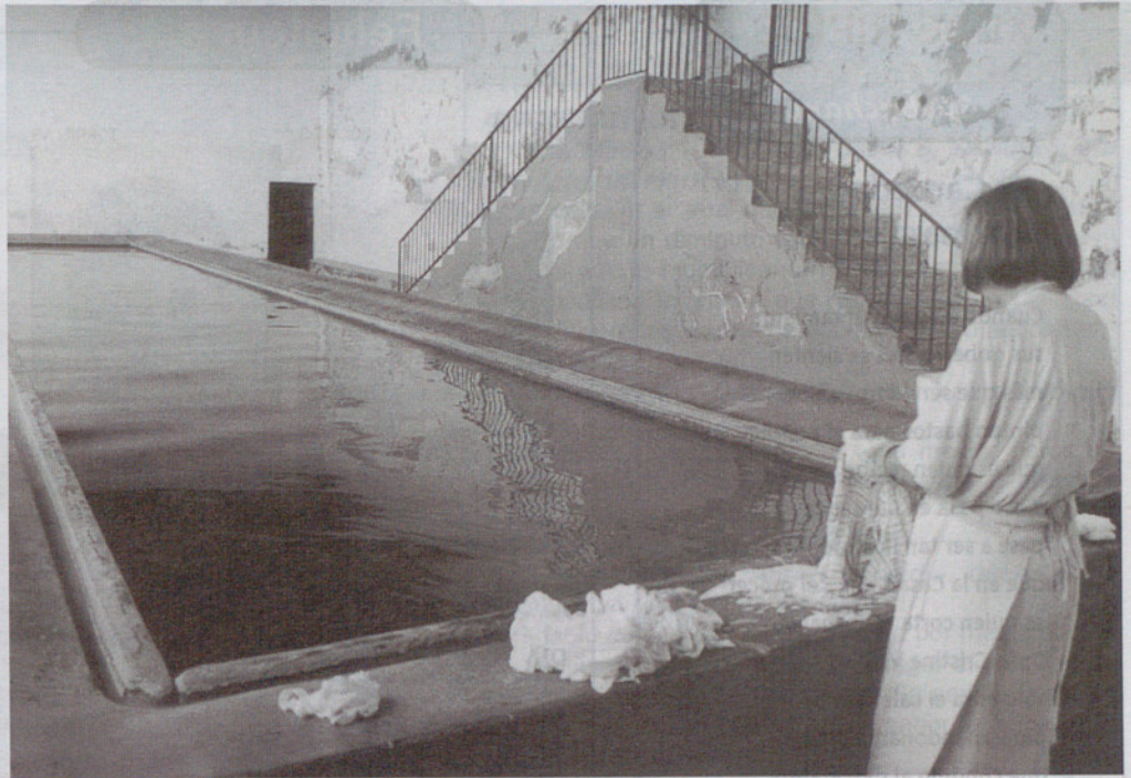
Uno de los lavaderos públicos de agua caliente.

Las Termas eran uno de los edificios más importantes de las ciudades romanas, ya fueran públicas, privadas, imperiales o medicinales. Allí se llevaban a cabo actividades relacionadas con la higiene y el ocio. En Caldes, las termas eran eminentemente medicinales, y tenían hasta 11 ámbitos conocidos en los que se realizaban distintos tratamientos. Además de este carácter terapéutico de las termas, no se perdió nunca el uso lúdico de las instalaciones. Cabe subrayar que aunque los romanos conocían bien las propiedades terapéuticas del agua termal, atribuían a los dioses, en última instancia, las curaciones o mejoras de las enfermedades que allí se trataban. Este hecho está documentado a través de distintas lápidas votivas en agradecimiento a las curaciones.