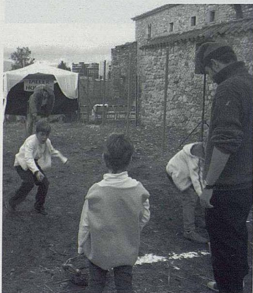
Festa del Glaç.

El recorregut va acabar a la plaça de la Vila amb l'entrega d'un obsequi a tots els participants.