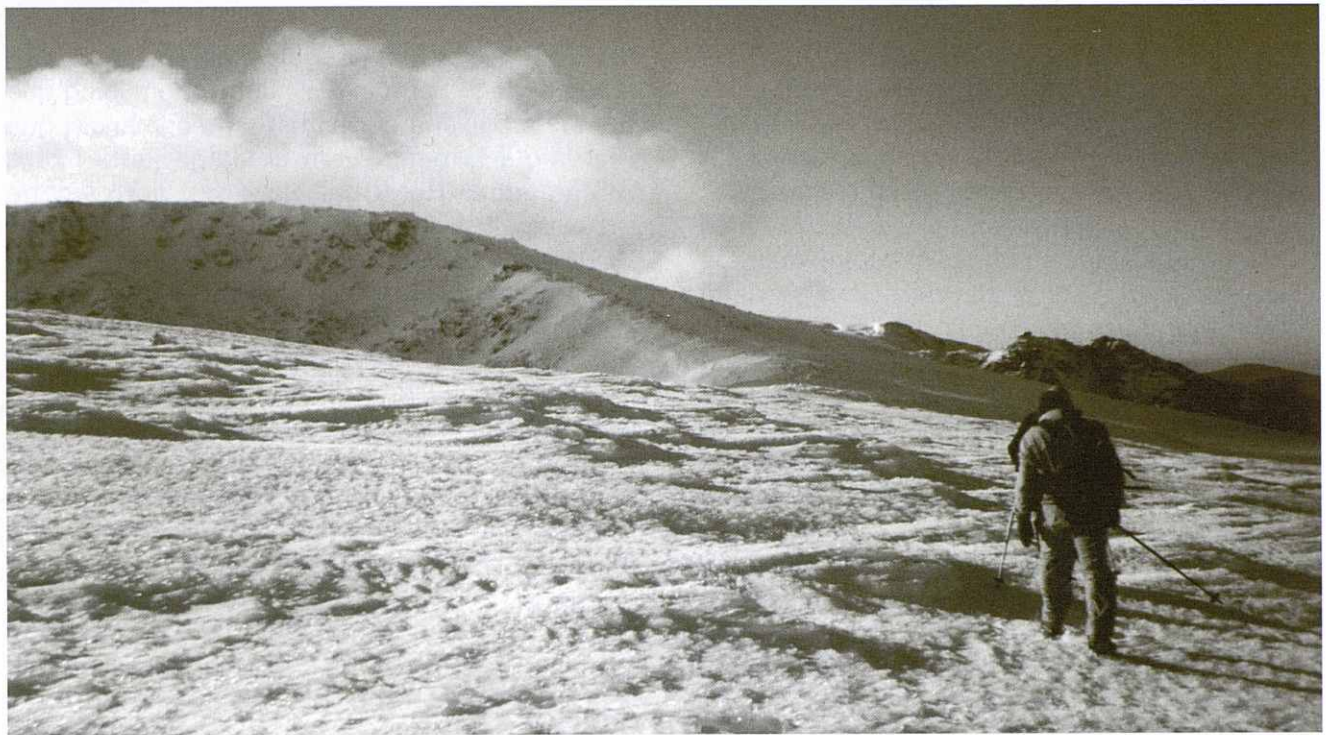
Pujant el Conchal de la Ceja (2.430 m) - Serra de Bejar - Candelario.

muntanyencs ben equipats. Em saluden i de seguida em pregunten si vaig cap al "Calvitero" i si vull anar amb ells. Els ho agraeixo i, tot seguit, comencem a tirar amunt. El vent bufa fort i com que la neu està molt gelada aviat ens posem els grampons. Anem pujant per un caminet i unes petges que aviat es perden i bo i aguantant forts cops de vent, al cap d'una hora i un quart arribem al cim del "Calvitero" de 2.404 metres. Des del cim es gaudeix d'una molt bona panoràmica cap a Gredos, cap a les planes de Castella, etc. És un vèrtex geodèsic de primer ordre i el pedró està completament gelat. Ens arrasarem una mica per menjar un mos i després continuem per la carena cap al sud. A sota del "Canchal" de la "Ceja" de