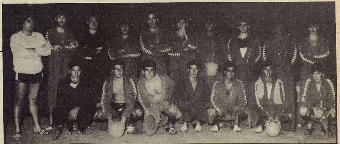
Deportistas de los equipos de waterpolo del C.N. Granollers.

Estas escuelas funcionan los meses de Octubre a Junio y el programa comprende actividades como la practica de :NATA-CION, GIMNASIA DEPORTIVA, FUTBOL SALA, BALÓN-CESTO, WATERPOLO Y NATA-CION SINCRONIZADA.