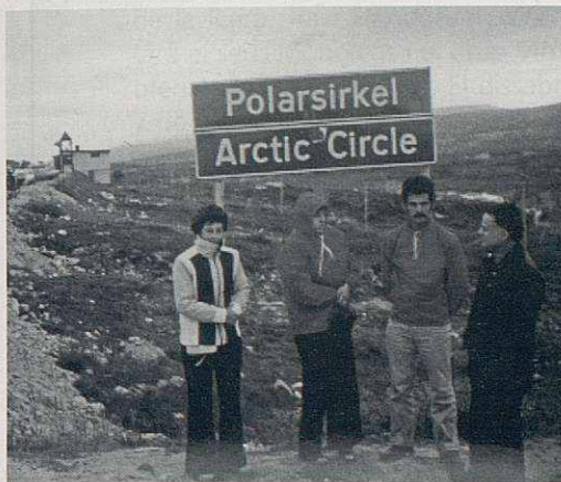
Al cercle Polar Artic.