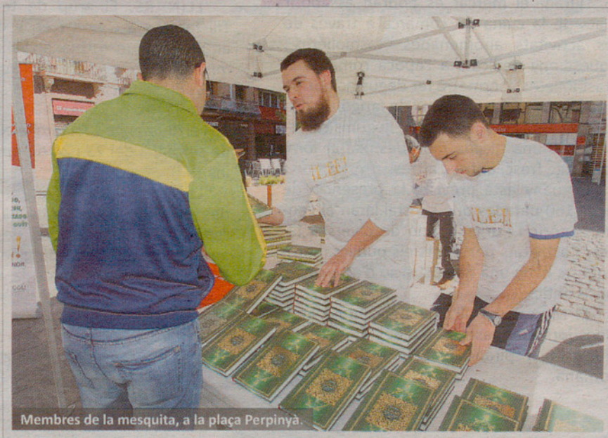
Membres de la mesquita, a la plaça Perpinyà.

Durant tot el matí i en un estand habilitat especialment per a l'ocasió, van repartir el llibre sagrat de l'Islam entre tots aquells curiosos que s'hi van acostar. Una bona manera de desfer tòpics equivocats i fomentar l'acostament i l'enteniment entre diferents cultures i religions. RdV