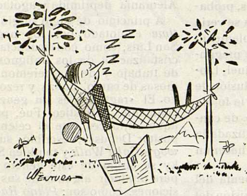
Este mes no hay chiste por estar el dibujante de vacaciones

Quise.— 7. Símbolo del sodio : Organismo internacional : Campeón.— 8. Abreviatura : Nota musical.— 9. Capital española.