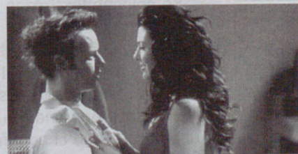
En busca de la idoneidad.

Personajes creados por Micahel Ende en "La historia interminable" que son extrapolados de aquel denso relato, para ofrecernos sus aventuras particulares.