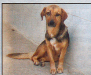
Cruce macho 3 años