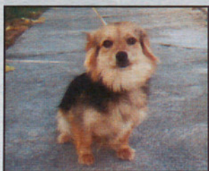
Cruce pequinés hembra 2 años