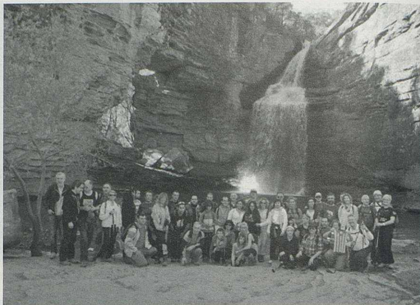
El grup de caminaires en un lloc sorprenent: la roca foradada. Ara hi podríem afegir: el salt d'aigua i el gorg i la font i l'entorn i.....

Des del darrer número d'aquesta revista hem fet dues sortides. La primera va ser a la roca foradada de Cantonigròs com centre d'interès important. Era el 14 d'abril i vam ser guiats per gent que coneix i estima el territori. Això va permetre conèixer detalls, anècdotes, racons que ens anaven mostrant el companys de Sant Julià de Vilatorrada.