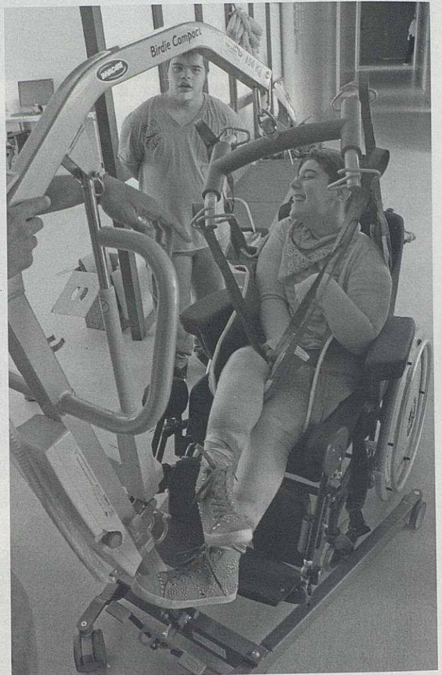
Aquest aparell permet a aquell que ho necessiti anar al lavabo amb més facilitat.

som una cooperativa de consum en què els usuaris i socis tenen participació activa en el límit de les seves capacitats. Aquest és un centre amb l'objectiu que els nois no perdin habilitats i que al dia de demà puguin endinsar-se en el món laboral. Això es treballa al centre, però també fent activitats exteriors com anar a la biblioteca, jugar a futbol o dur a terme una excursió.