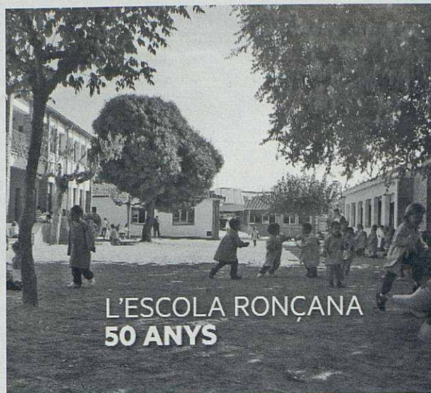
Portada del llibre commemoratiu.