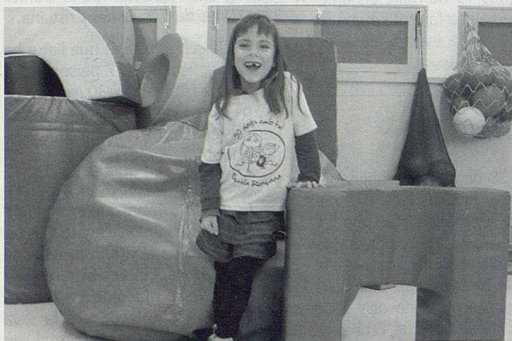
Una samarreta per recordar els 50 anys.