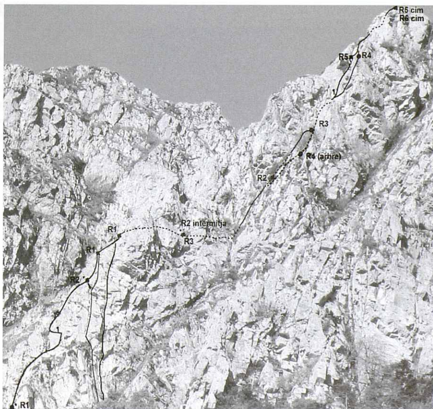
Via Navegant i cagamanduries

La via compta de sis llarg que ens porten fins a la cresta de Castellet i des de aquí fins al cim de Les Agudes.