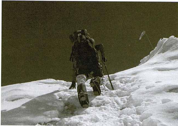
Tram de penitents per sota del camp I a 5.900m.

acolliran les properes tres setmanes en un camp base on hi ha algunes altres expedicions, sortosament no gaires fugint de la massificació que diuen que hi ha actualment en aquestes muntanyes.