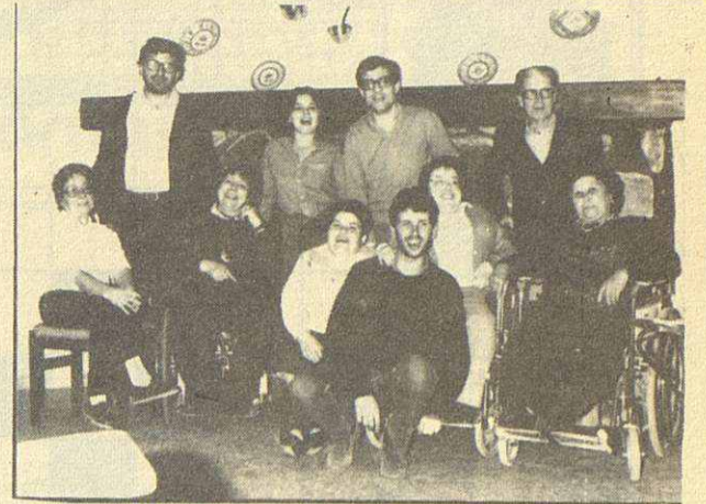
L'equip diocesà de la Fraternitat (1986)

M'imagino la sorpresa dels mollerussencs en llegir-ho i, fins i tot (si sabessin llegir, és clar) la de les vaques que hi pasturen, segons la coneguda cançó de «La