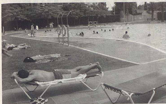
Ca n'Arimon es otra de las alternativas para refrescarse

ochenta son los establecimientos hosteleros que han pedido autorización para colocar sus terrazas en las aceras de la ciudad. El horario permitido según la ordenanza de Convivencia y Vía Pública es de lunes a jueves de 9 de la mañana a 0,30 horas de la noche, mientras que de viernes a domingo y vigilias de festivos el horario se alarga hasta las 2 de la madrugada.