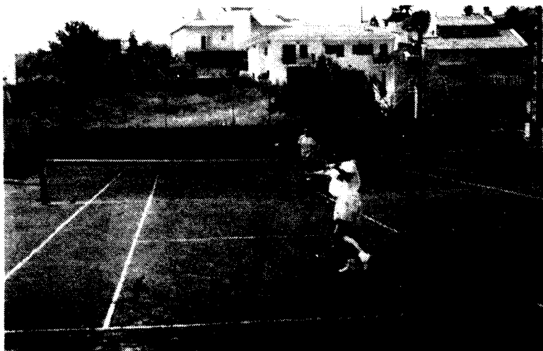
Una fase de la final femenina

matx va ser digne de presenciar doncs ambdues parelles van fer valer en els corresponents jocs de cops d'escola però els vencedors serien Vidal-Selga en dues mànegues realment igualades 6-4/7-6.