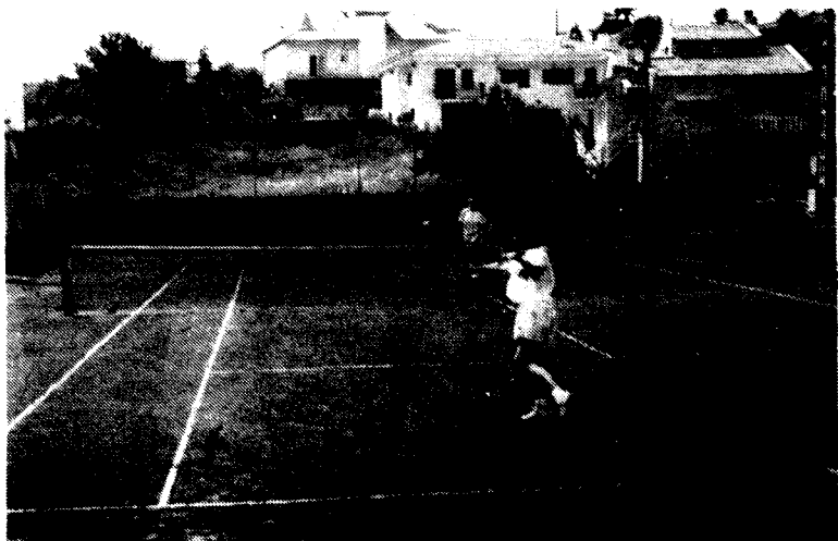
Una fase de la final femenina

matx va ser digne de presenciar doncs ambdues parelles van fer valer en els corresponents jocs de cops d'escola però els vencedors serien Vidal-Selga en dues mànegues realment igualades 6-4/7-6.