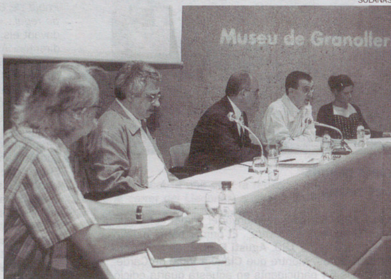
Signatura del conveni de col.laboració entre Quebec i Granollers.

L a Beca Granollers Arts Visuals es convocarà amb una periodicitat anual i té com a finalitat donar suport a la creació, producció i difusió de l'obra dels artistes contemporanis en l'àmbit de les arts visuals. La convocatòria forma part de les eines de col.laboració previstes entre Le Conseil des Arts et des Letres du Quebec i l'Ajuntament de Granollers, que a més a més dels intercanvis, té com a finalitat afavorir la participació en un projecte comú, consolidar lligams amb institucions públiques o privades, associacions i administracions nacionals i estrangeres que permetin donar continuïtat a aquesta iniciativa, facilitar la difusió internacional i la professionalització dels artistes locals, potenciar el paper de les xar-