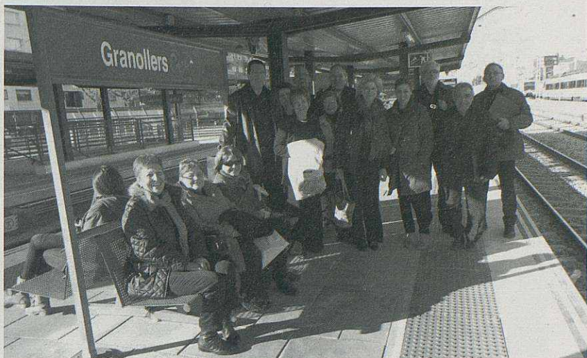
Representants de la coral a l'estació de Granollers

En el número anterior de la revista ja explicàvem que, juntament amb la Coral Amaranth de Bigues, estem preparant el viatge a Escòcia pel pont de Sant Joan, on oferirem dos concerts. El més important d'ells tindrà lloc a la Catedral d'Edimbourg on ja tenim dia i hora reservada per a la nostra actuació. Ara mateix tenim dues feines molt importants a fer: assajar molt i molt bé les cançons que hem