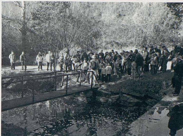
La caminada seguint el riu Tenes.

ticipació de nens i nenes amb els seus pares i mestres. Una jornada distesa de convivència i celebració, oberta a tothom. Aquesta és una excursió emblemàtica de la nostra escola que l'han anat fent tots els alumnes de 4t al llarg dels anys.