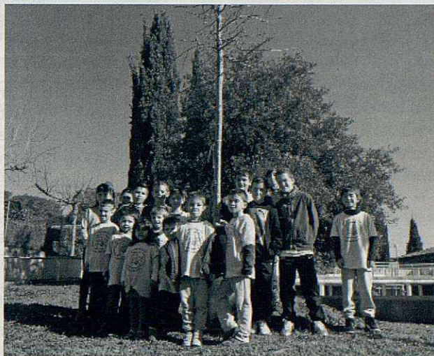
Els delegats de tots els cursos després de plantar el roure.

Ja ens preparem per tancar el curs. Estem contents d'haver pogut fer aquestes activitats de celebració i donem les gràcies a tots els qui ens hi heu ajudat. Entre tots ha estat possible. Ara cal mirar endavant per fer el futur encara millor. Per molts anys!