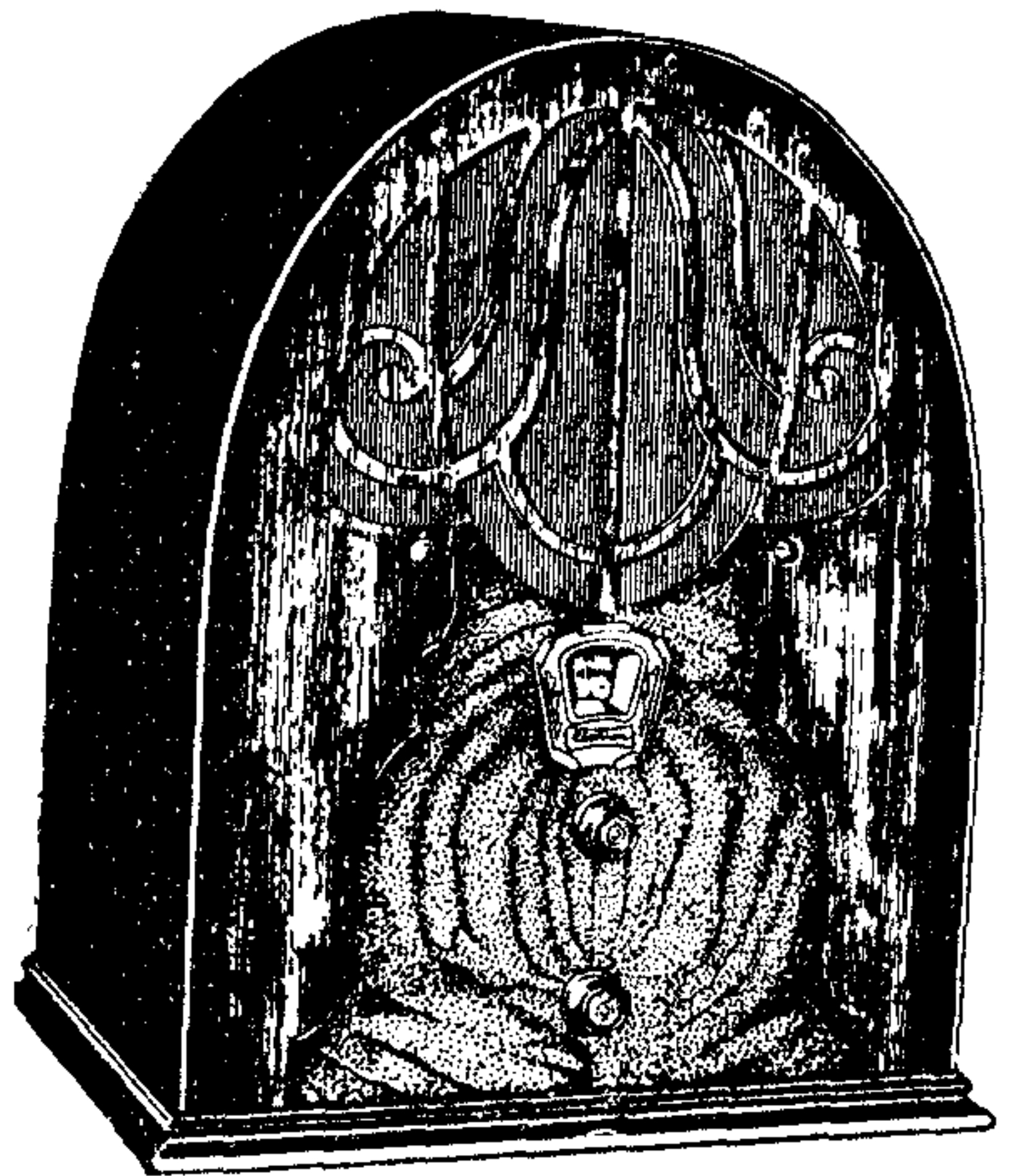
Model 40, de 5 vàlvules

Model 80 —Amb circuit Superheterodino . És el receptor ideal per excel·lència per a tots els que desitgin una selectivitat extremada. Es difícil trobar un receptor que l'avantatgi. Equipat amb vàlvules Multi-mu i Pentodo . Va proveït de tots els refinaments i avenços fins el dia i amb altaveu dinàmica TCA .