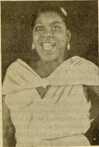
Bessie Smith, emperatriz del Blues

Días atrás, en una de las frecuentes tertulias que se sostienen en nuestro Hot Club, después de una interesante sesión comentada de discos, estuve presenciando una discusión entre varios hotfans en la que salían amalgamados cantidades de nombres: Gillespie, Armstrong, Ellington,