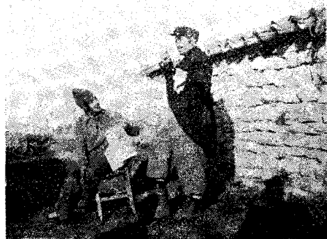
En Serres i En Ter. Aquest llueix un elegant frac feixista de Cuarte