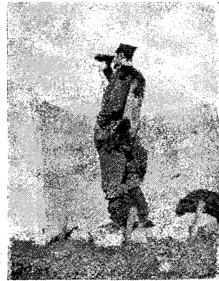
Zanotti, el brau italià abillat amb una pell de bèstia