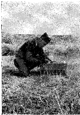
El barber es dedica a la correspondència.