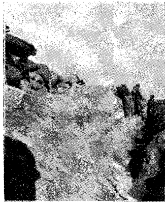
Una trinxera a la posició Hernández-Royo