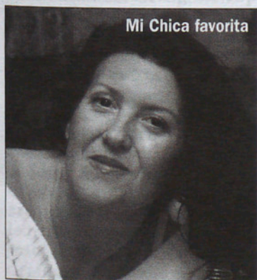
Mi Chica favorita