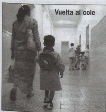
Vuelta al cole

Nos ha sorprendido comprobar como el nuevo adoquinado colocado en el Camí Ral, en el tramo de Can Junyent sobresale varios centímetros por encima de las puertas de las casas. ¿Que pasará los días de tormenta? (31). El tornado que el jueves de la semana pasada asustó en el Baix Vallès ya tiene precio: medio millón de euros. Podría haber sido peor (27). Cada vez parece más claro que Montmeló podrá soterrar la vía del tren. Sólo quedan los últimos flecos con el Ministerio (68). Todo esto y mucho más con una espectacular Bolsa de Trabajo. No se han equivocado al elegirnos.