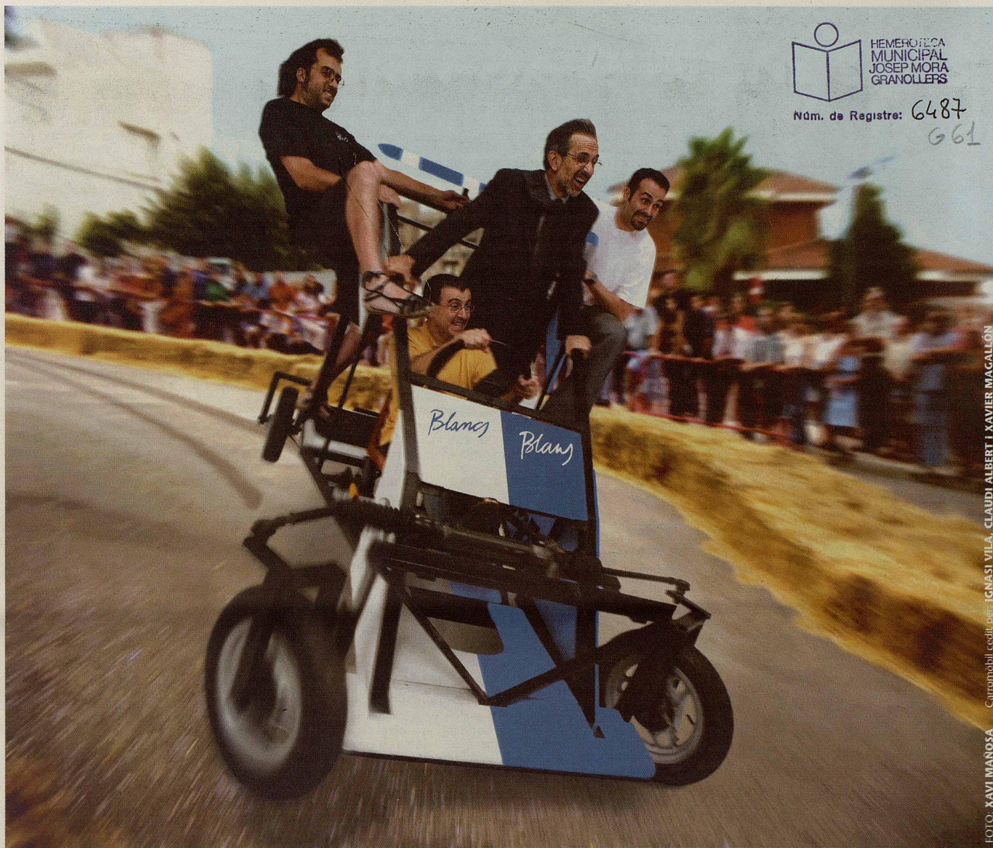
Carromòbil cedit per: IGNASI VILA, CLAUDI ALBERT I XAVIER MAGALLÓN

Quan l'estiu s'acaba i s'acosta anar a currar... la Festa Major de Granollers ens sorprèn de nou amb un gran nombre d'activitats i nous espais de la ciutat que durant una setmana es convertiran en blancs i blaus. Són uns dies que ens conviden a sortir al carrer a gaudir plegats de l'àmplia oferta de propostes festives, a compartir emocions, il·lusió i alegria i a animar les colles en la competició: Blancs i Blaus ara és l'hora d'estripar!