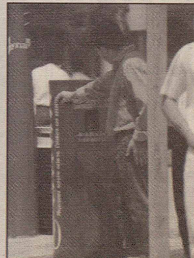
Contenedor de llaunes

El reciclatge de les llaunes permet recuperar l'alumini i reduir el volum dels residus urbans. La utilització dels contenidors requereix la col·laboració dels usuaris ja que, a més de dipositar-hi la llauna, han d'accionar una palanca per compactar-la. Amb la instal·lació dels contenidors de llaunes es va introduint la recollida selectiva de residus. Recordem que als centres escolars ja hi ha contenidors per a paper i per a piles.