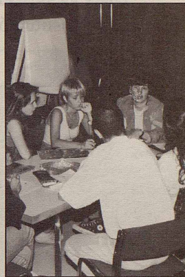
Les persones que fan les visites van fer un curset prèviament

l'any que l'Ajuntament cobrarà abans del 30 d'abril. Acollir-se a aquesta forma de pagament comporta avantatges importants. D'una banda, no se'ls carregarà en compte l'impost de vehicles de tracció mecànica i/o els guals que s'havien de pagar els mesos de febrer i març fins el 30 d'abril. D'altra banda, el pagament conjunt de tots els impostos implicarà un descompte del 4 % i la comoditat d'oblidar-se del tema i d'evitar-se cues a l'Ajuntament,