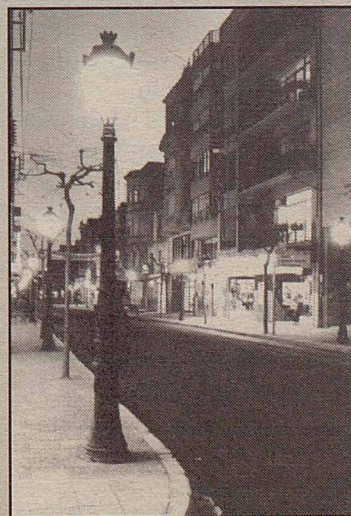
Model de fanal que s'instal·larà al carrer de Joan Prim

i la Guàrdia Urbana ha mantingut un servei permanent de regulació durant el dia, amb cura especial de les hores puntes.