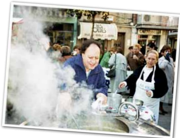
INAUGURACIÓ DEL MONUMENT A L'OLLA EL DIA 15 DE DESEMBRE DE 2000.