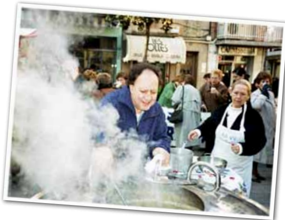
INAUGURACIÓ DEL MONUMENT A L'OLLA EL DIA 15 DE DESEMBRE DE 2000.