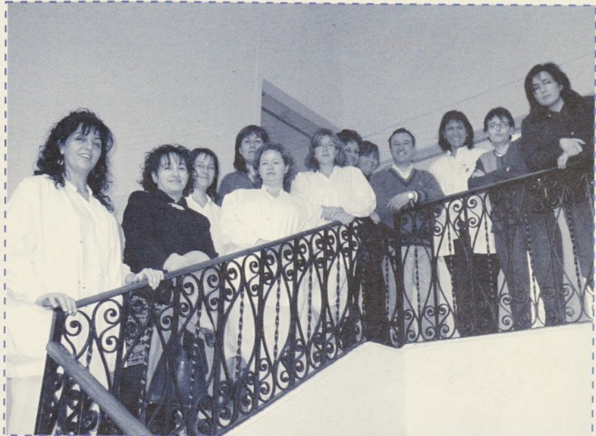
La Junta d'Infermeria està formada per una quinzena de professionals de l'Hospital

La Junta d'Infermeria, que es reunirà com a mínim un cop al mes, té com a funcions vetllar per la qualitat tècnica i assistencial tenint en compte la formació contínua,