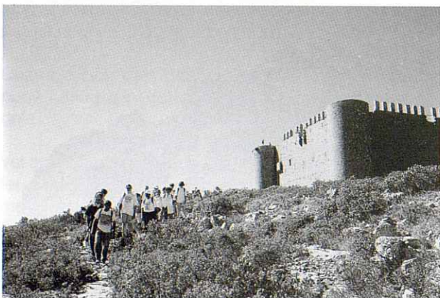
Vista parcial del Castell de Montgrí.

Baixem per una zona bastant pedregosa per arribar a la zona de les dunes, que es varen formar degut a la Tramuntana que transportava les sorres, per frenar-ho,