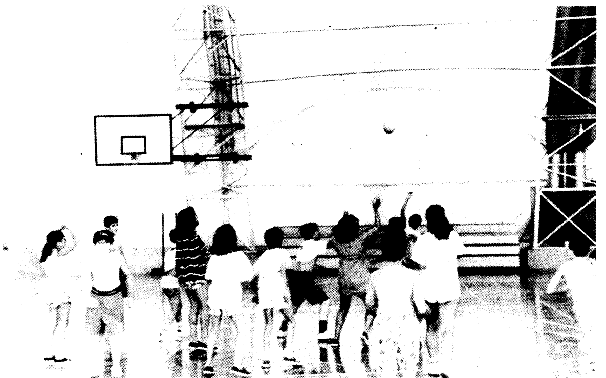
Pavelló Congost, jugar és passar-ho bé.

Però aquest programa es pot veure modificat per tres altres activitats: excursió en autocar, excursió a peu o activitats a Ponent-Congost. L'excursió en autocar a Castelldefels ja s'ha fet altres anys, i es tracta de passar tot el dia en aquesta població fent diferents activitats: pel matí anar a un petit parc d'atraccions, dinar al migdia, i a la tarda banyar-se a la platja i llançar-se per uns tobogans aquàtics. Com que només es fa dos dies, no poden anar-hi tots els nens i s'ha de fer per sorteig, que aquest any va fer que hi anessin els grups A-6 i A-10 el dia 11, i els I-13 i J-16 el dia 18. Les excursions a peu, que es fan aquest any per primer cop, són fetes cada dia per dos grups, i cada grup en fa dues. Les excursions són, bàsicament, d'uns 14 Km. pels voltants de la nostra ciutat, com ara a Marata, la Roca o Palou, amb tornada a