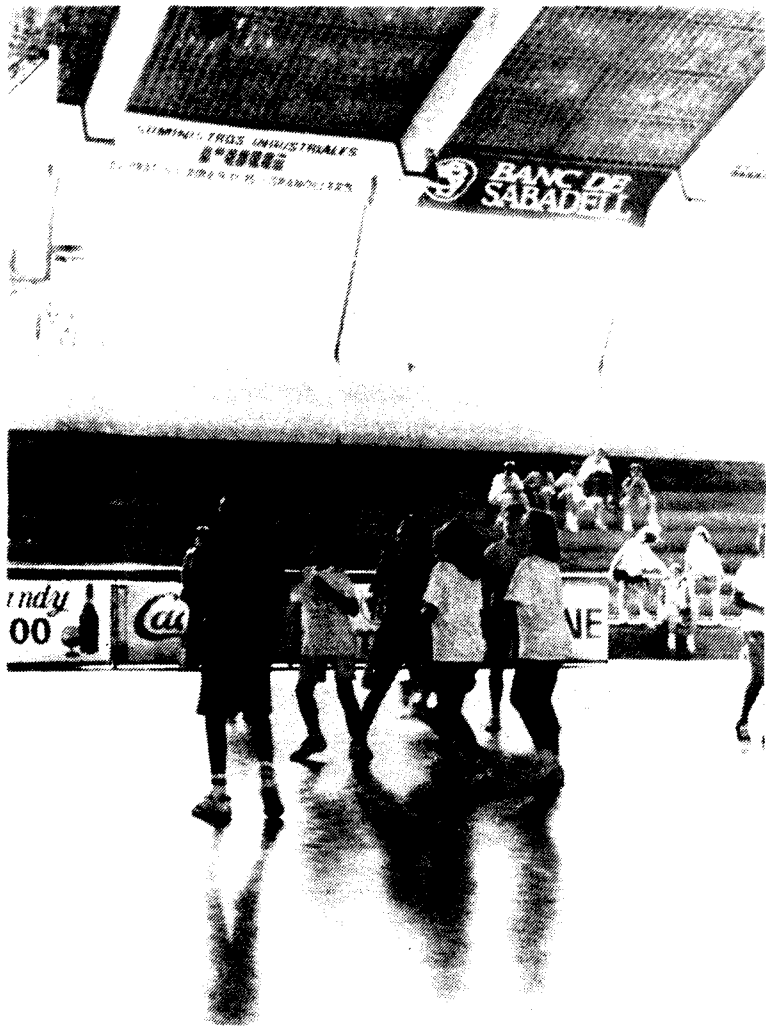
Al Pavelló Municipal d'Esports, escola de bàsquet.

inscripció i l'altra meitat dels nens fan diferents jocs, cosa que és fa a l'inrevés a la segona hora. Aquestes activitats es