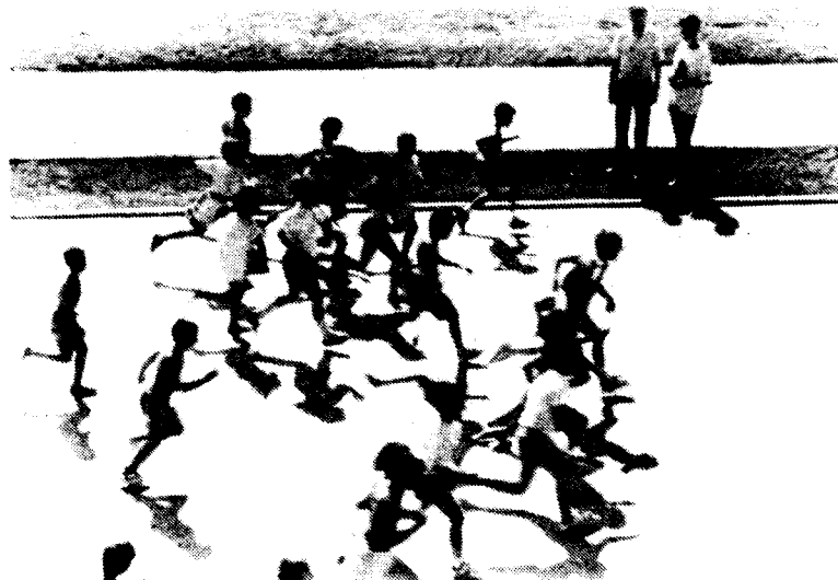
Córrer és un joc.

prop de les dues de la tarda. Però per als més grans hi ha dues excursions força més bones: El Figaró-Tagamanent