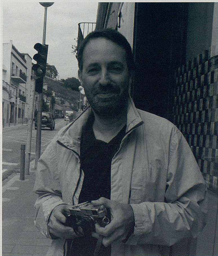
El fotògraf amb la seva càmera Leica del 1957, com la que tenia Cartier-Bresson

Comença que un dia envio un correu a 18 persones de Lliçà que fan coses (escriuen, canten, són artistes...) i les convoco per crear alguna cosa durant una hora. Ho vaig fer per sacsejar les excuses del "no puc". Em pensava que estaria sol però van venir deu persones.