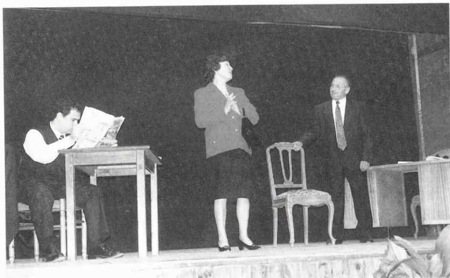
Fragments "D'aquesta aigua no en beurrè", una magnífica obra de gran comicitat, foren representats amb gran èxit en l'homenatge a Josep Ma. Folch i Torres.