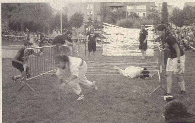
Momento de la Garrinada