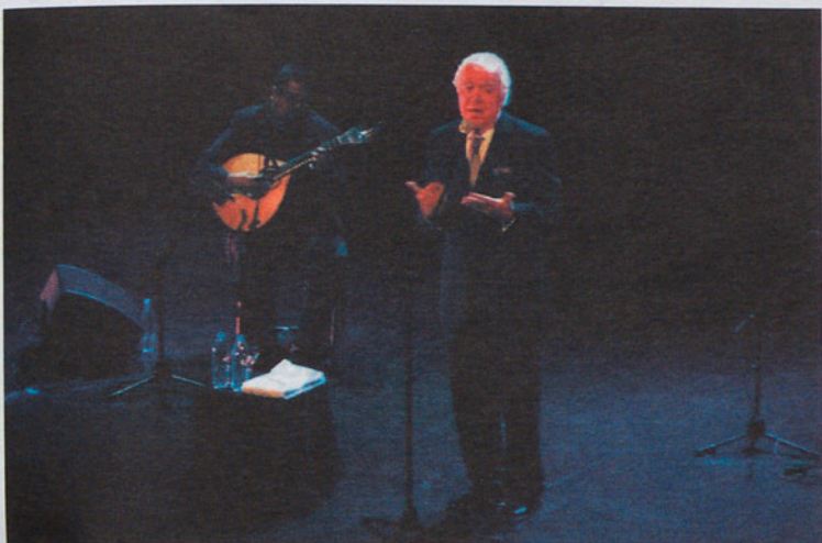
Carlos do Carmo va oferir a Cardedeu la seva primera actuació a Catalunya.