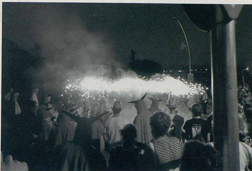
L'actuació d'estrena dels Diablers.

L'activitat del diumenge va acabar amb una nit màgicòmica al pavelló,