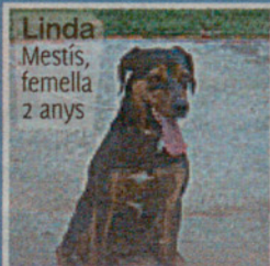
Linda Mestís, femella 2 anys

Trucar al telèfon 93 843 02 53 CAN MORET (l'Ametlla)