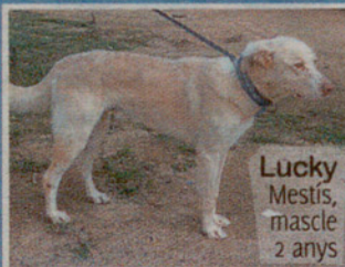
Lucky Mestís, mascle 2 anys